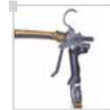
inoCOLL yapıştırıcı tabancası