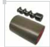
Spiral karıştırıcı ve çerçevesi