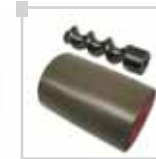
Spiral karıştırıcı ve çerçevesi